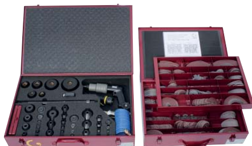
KVS 369/65 Werkzeugkoffer mit Schleifwerkzeugen und mit Schleifmittel