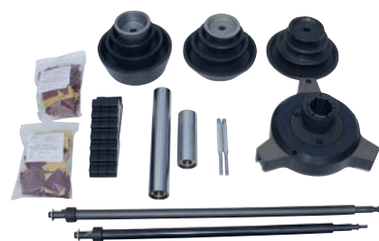
KVS Werkzeuge, Arbeitsbereich DN 80-150 (3"–6")

Andere kundenspezifische Kombinationen, Sondergrößen, Sonderwinkel können geliefert werden. Geringfügige Änderungen im Arbeitsbereich sind möglich sowie Werkzeughalter zur Vergrößerung der Arbeitstiefe.