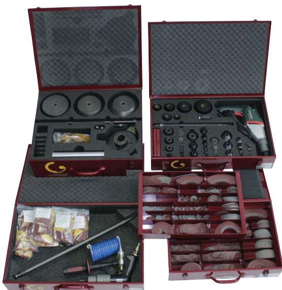
KVS 369/150K Werkzeugkoffer u. Schleifmittelkoffer

Für die großen Nennweiten von DN 150–300 und für tiefe Armaturen liefern wir einen Maschinenarm mit federbelasteter Schleifspindel.